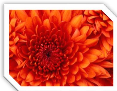
Slika 1: Cvet

(Dodati sliku u tekst, smanjiti je na proizvoljne dimenzije, tako da slika ne prelazi na drugu stranicu. Postaviti stil (okvir) po izboru.)